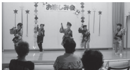
生きがい活動 おたのしみ会

内容 ：健康チェック、入浴、昼食、休養、軽運動、各種レクリエーション行事など ※月に3～4回、マイクロバスで送迎します。