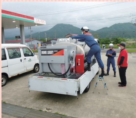
移動タンク貯蔵所の検査の様子