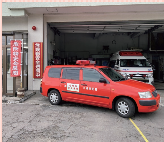
のぼり、看板等の掲出

☑ 広域広報へのご意見やご要望をお寄せください。 Eメール： オー o-kouiki@shirakami.or.jp