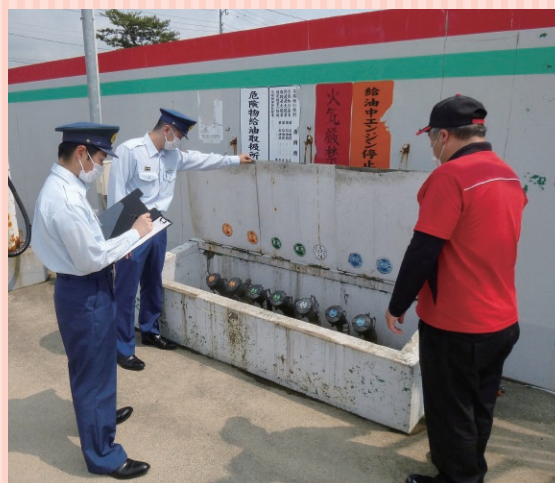
注入口の検査の様子