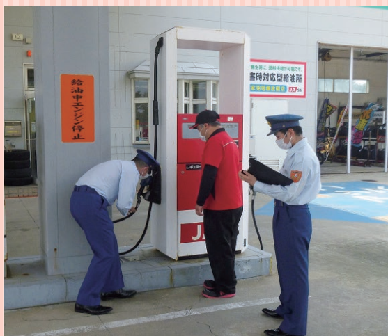
固定給油設備の検査の様子

八峰消防署では、給油取扱所や移動タンク貯蔵所などの立入検査のほか、のぼりの掲出等を実施しております。