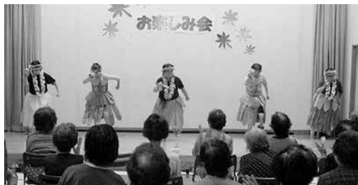
生きがい活動 おたのしみ会