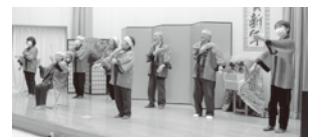
生きがい活動 新年会