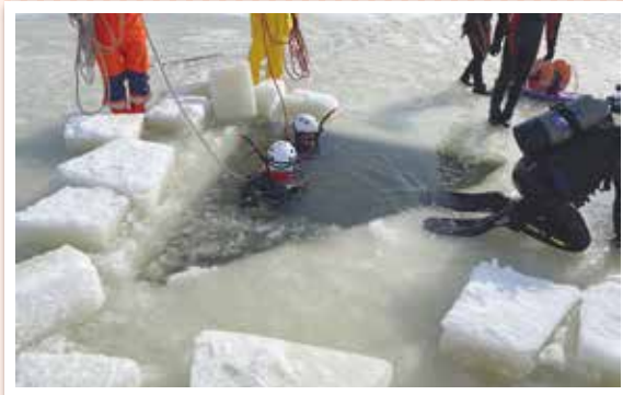
●三種町東部承水路のワカサギ釣り事故を想定して、氷下へ潜水する訓練

能代山本広域市町村圏組合消防本部では、多種多様化する災害に備え、日々各種訓練を行っています。