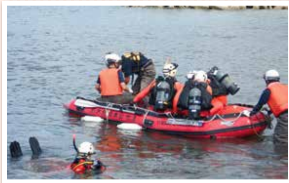
●救助艇の操船訓練