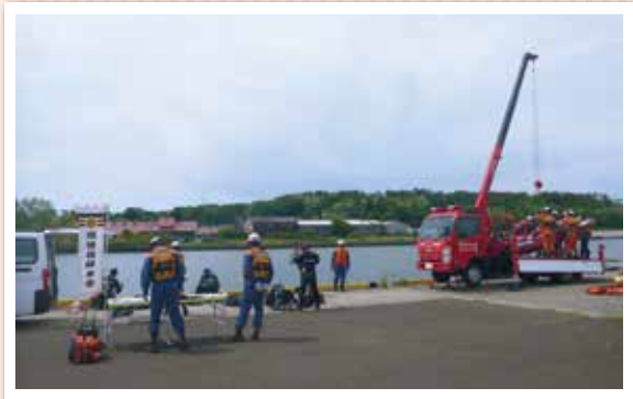
●水難救助隊、指揮隊、特別救助隊の合同訓練