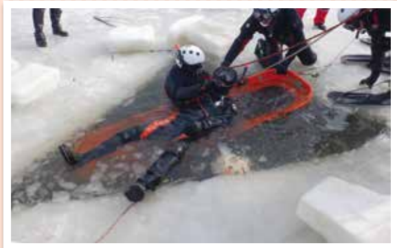
●氷下で発見した要救助者をバスケット担架へ収容し救出する訓練

私は、隊長として、安全管理の徹底に心掛けています。隊員全員が無事に任務を遂行できるよう、訓練を重ねて技術の向上に努め、これからも地域住民の安心安全を守るため日々努力してまいります。