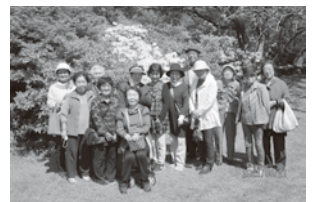
能代公園ツツジ見学